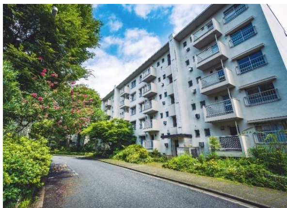
建替え前 石神井公園団地

今般竣工した「Brillia City 石神井公園 ATLAS」は、地上7～8階建て、総住戸数844戸の大規模分譲マンションです。全棟南方位かつゆとりある配棟計画としているほか、旧団地から移植した樹木を含む敷地内緑化により、豊かな自然に囲まれた住環境を実現しました。