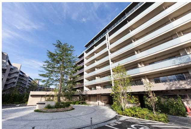
建替え後 「Brillia City 石神井公園 ATLAS」