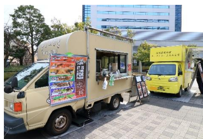
イベント開催イメージ