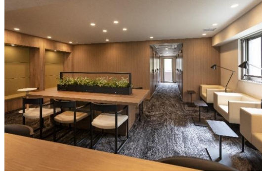
スタディールーム