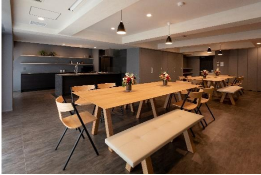
パーティールーム

また、お祝い事などに利用できる「パーティールーム」や、リモートワーク・勉強などに利用できる「スタディールーム」といった大規模マンションならではの多彩な共用施設を備えることにより、居住者の健康と安全・安心、活発なコミュニケーションの醸成をサポートします。